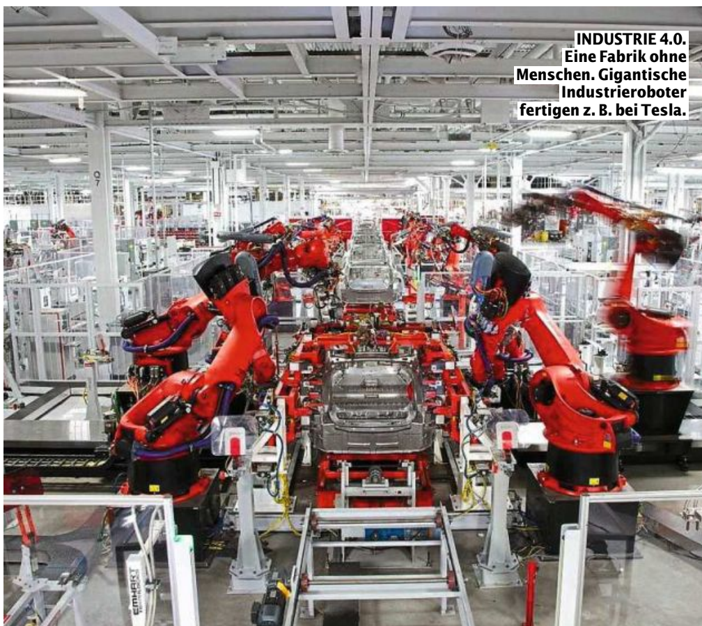
INDUSTRIE 4.0. Eine Fabrik ohne Menschen. Gigantische Industrieroboter fertigen z. B. bei Tesla.

G leich das Positive: Sie und ich, wohlwollende Leserschaft, erfreuen uns quicklebendig des Daseins. Die kaum zu glaubenden Fortschritte in der Medizin versetzten viele von uns, die es ohne Erstere nur noch „in seligem Angedenken“ gäbe, in die Lage, wohlgemut in dieser Zeitung zu lesen. (Bedauerlicherweise stehen uns dabei oft die Haare zu Berge.) Eine wachsende Zahl tut das per Mausclick.